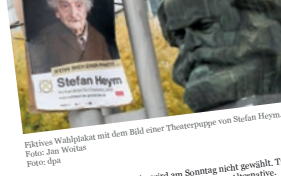
Fiktives Wahlplakat mit dem Bild einer Theaterpuppe von Stefan Heym.

Chemnitz: Mit Kunst gegen einseitiges Bild der Stadt