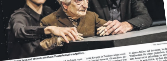
Ein Stück über Stefan Heym und Chemnitz wird dieses Theaterfestival uraufgeführt.